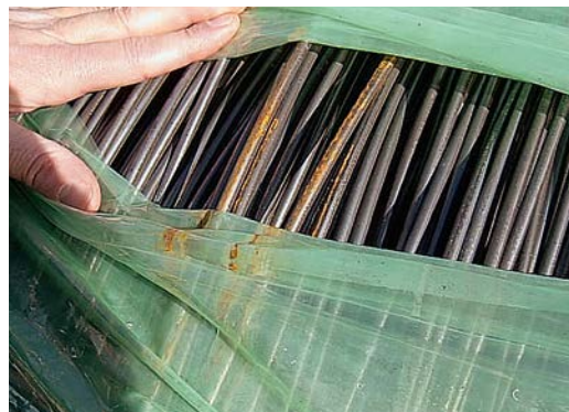
Product na transport zonder VCI-bescherming