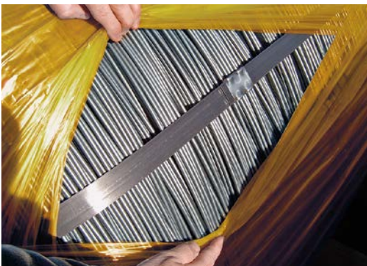
Product na transport met VCI-bescherming