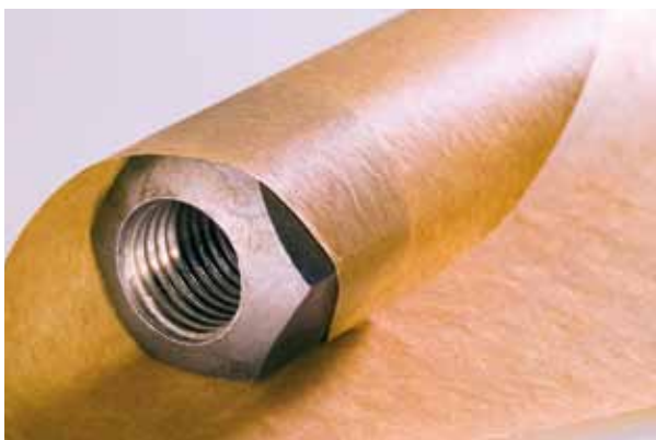
Perfect verpakte delen, ideaal voor de machinebouw