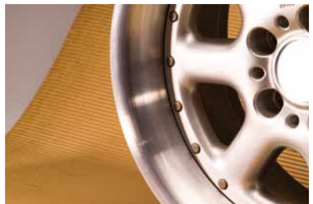
Goed beschermd door karton uitgevoerd met VCI