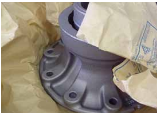
Onderdeel na het transport met VCI bescherming