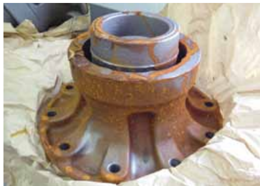
Onderdeel na het transport zonder VCI bescherming