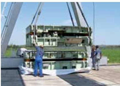
Verpakking, stap 1