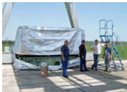
Verpakking, stap 2