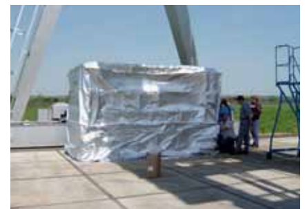
Verpakking, stap 3